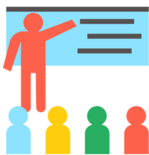
Education thérapeutique classique

Le maintien de l'éducation thérapeutique du patient grâce au numérique : associer le digital à l'humain